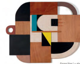
Forma libre I y, abajo, Composición de letras 0020; piezas en las que Rich despliega su doble faceta de ceramista y pintora, ambas en Galería También, su propia galería.

vintage y de arte que se llama También”. El nombre es por todo lo que pueden llegar a representar: “Y porque suena bien”, añade desacomplejada. Y una vez montada la galería –que ahora gestionan principalmente su marido–, ella volvió a lo suyo, a la creación, en un taller construido a medida que le permite trabajar tanto indoor como outdoor . Comienza a las 9 de la mañana y alarga la jornada más allá de las 5 de la tarde. A veces mucho más. “Trabajo mucho, porque es lo que me gusta”, se sincera. “Me encanta fabricar, estar haciendo cosas. Tengo mucha suerte”.